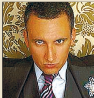
MAG LARI MAG I IL·LUSIONISTA

L'equip que dirigeix a la Maternitat de l'Hospital Clínic va practicar l'any 2011 diverses operacions a fetus utilitzant tècniques pioneres.