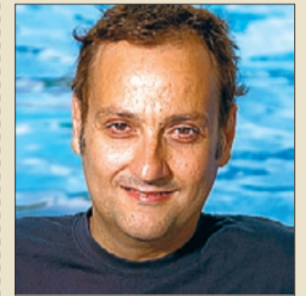
ALBERT ESPINOSA ESCRITOR I GUIONISTA

El 2011 es va convertir en la primera dona d'Espanya a fer la volta al món sense escales. Va recórrer 46.000 quilòmetres en 102 dies.